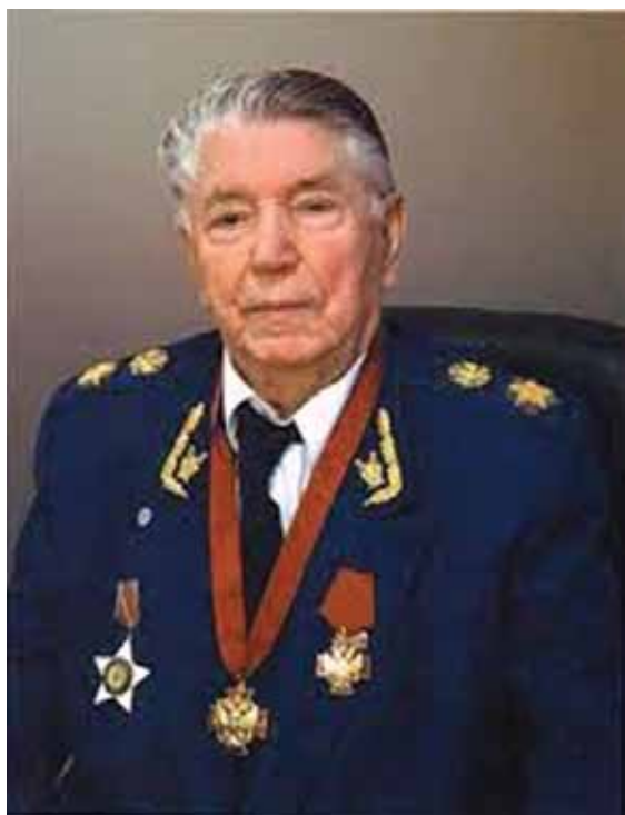
СУХАРЕВ Александр Яковлевич (1923-2021)

Министр юстиции РСФСР с 15 марта 1984 года до 25 февраля 1988 года.