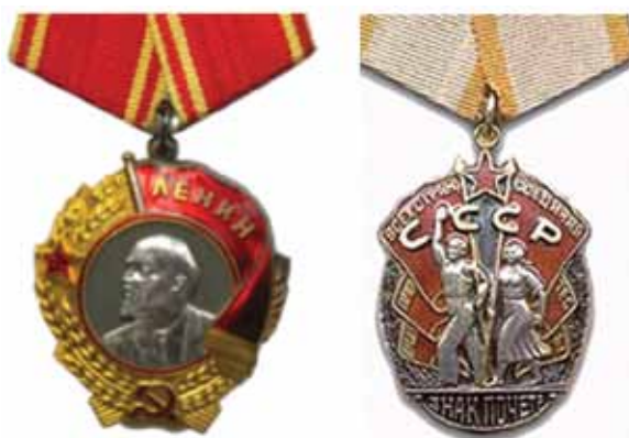
Награды В.А. Болдырева: Орден Ленина и орден «Знак Почёта».