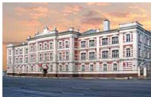
Москва. Институт Красной профессуры. Всесоюзная правовая академии НКЮ СССР (ныне – Московский государственный юридический университет имени О.Е. Кутафина).