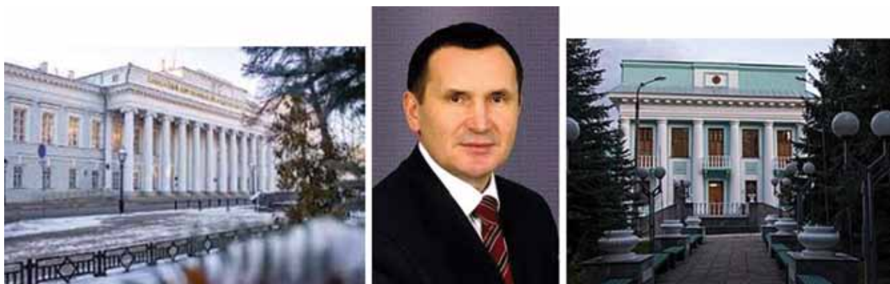
Юридический факультет Казанского университета. Чувашский государственный университет им. И.Н. Ульянова.