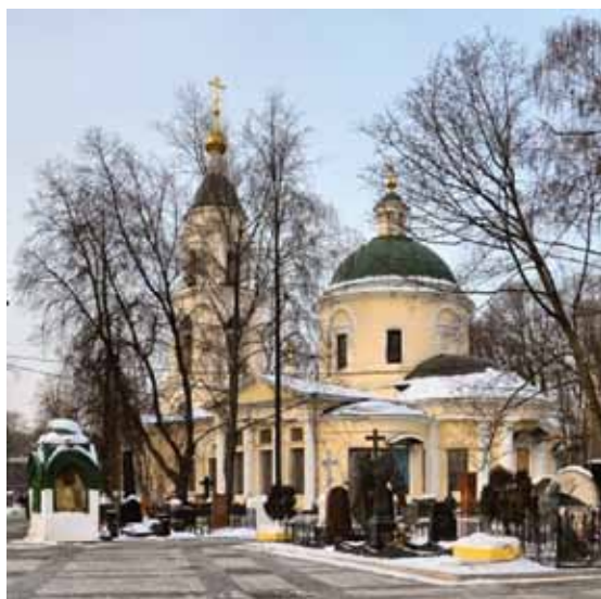
Москва. Ваганьковское кладбище.