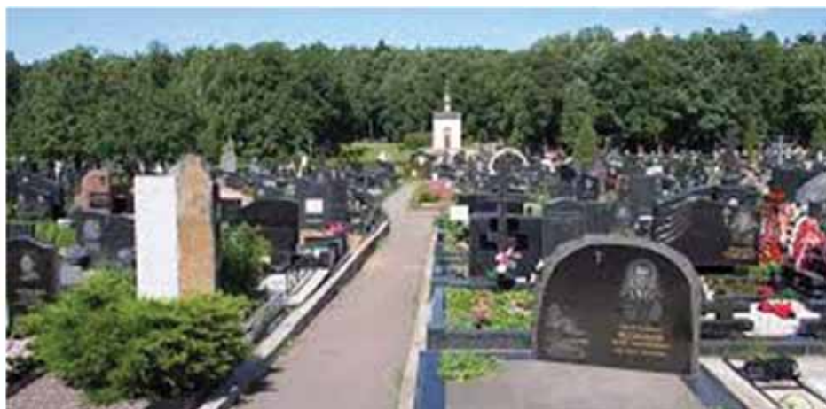
В.М. Блинов. Троекуровское кладбище в Москве.