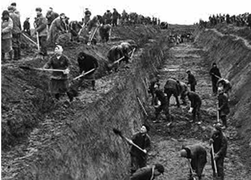
Строительство оборонительных рубежей в Московской области. 1941 год.

За достигнутые успехи в марте 1945 года он был награжден орденом «Знак Почета», в мае 1947 года – орденом Трудового Красного Знамени. В эти же годы ему было вручено несколько медалей, он не раз поощрялся Прокурором РСФСР и Прокурором СССР.