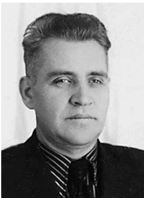
КРУГЛОВ Алексей Андреевич (1907 – 1974)

а в союзных и автономных республиках эта процедура затянулась на долгие годы. И только в апреле 1963 года министерство юстиции РСФСР было упразднено и назначен Председатель юридической комиссии при СМ РСФСР, которым стал Алексей Андреевич Круглов.