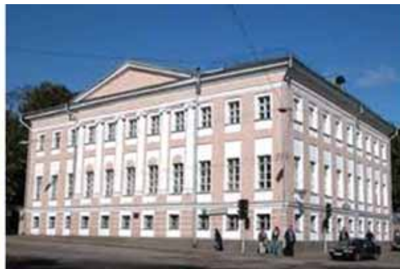
Отцовский монастырь в селе Зоврети (Мсоврети). Московский институт советского права им. П.И. Стучки.