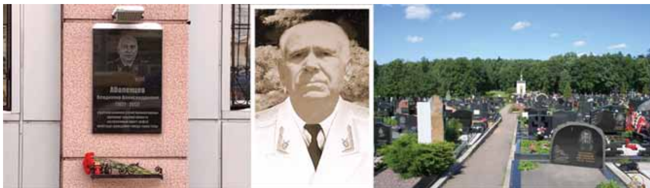
Мемориальная доска на фасаде здания прокуратуры Тульской области. В.А. Аболенцев. Троекуровское кладбище в Москве.