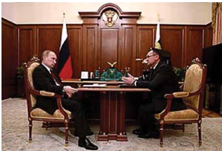
Рабочая встреча с президентом Владимиром Путиным, 2015 год.

Николай Васильевич Федоров является Почётным гражданином Чувашской Республики и Почётным гражданином Мариинско-Посадского района Москвы.