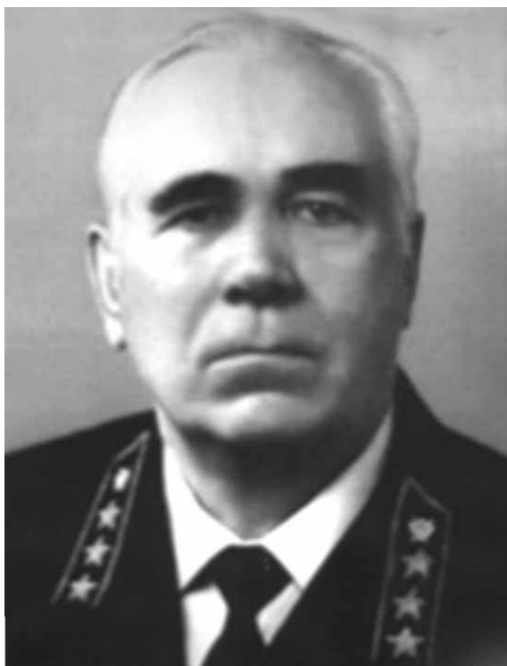
АБОЛЕНЦЕВ Владимир Александрович (1927 – 2012)

Министр юстиции РСФСР с 5 апреля 1988 года до 15 июня 1990 года.