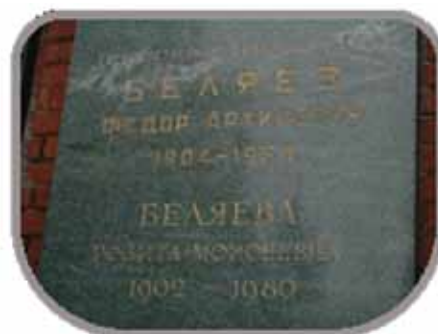
Мемориальные таблицы в Колумбарии Москвы