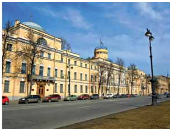
Иваново-Вознесенск в начале XX века. Ленинградское Высшее военно-морское училище им. М.В. Фрунзе в Ленинграде.

и мнению ветеранов органов прокуратуры, часто встречался с ними, стремился восполнить свои знания.