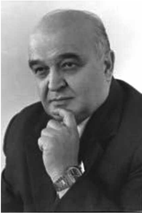
ТЕРЕБИЛОВ Владимир Иванович (1916 – 2004)

Министр юстиции СССР с 1 сентября 1970 года до 12 апреля 1984 года