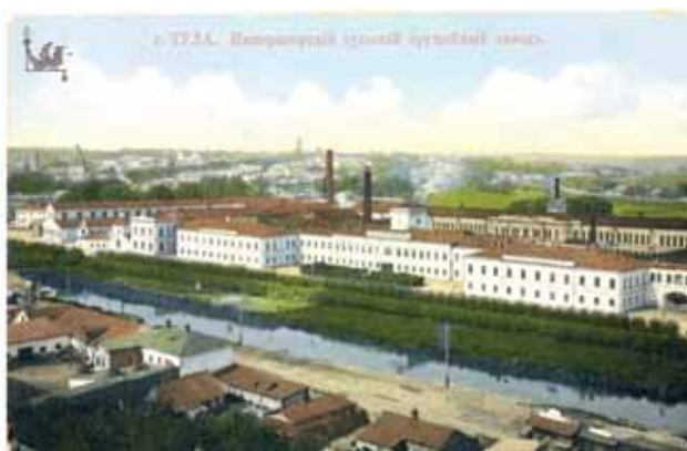
Село Фурсово Белевского района Тульской области. Тульский оружейный завод.