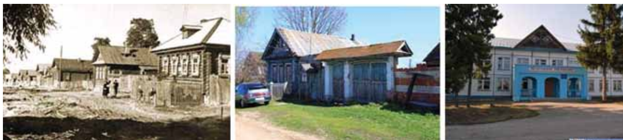
Деревня Чёдино Мариинско-Посадского района Чувашской АССР. Село Миснеры Чебоксарского района Чувашской АССР. Толиковская средняя школа Чебоксарского района Чувашской АССР.