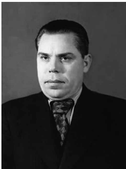
РУБИЧЕВ Анатолий Тимофеевич (1903 – 1973)

Министр юстиции РСФСР с 11 июня 1953 года до 27 марта 1957 года.