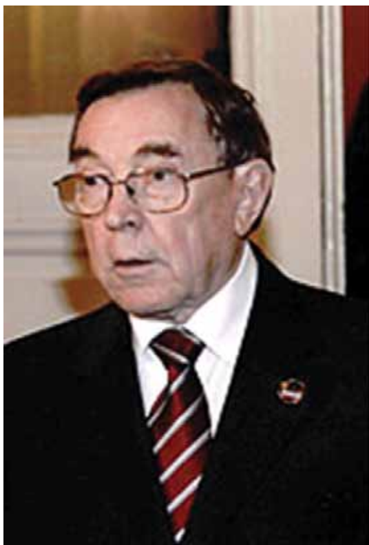
ЯКОВЛЕВ Вениамин Федорович (1932 – 2018)

Министр юстиции СССР с 11 июля 1989 года до 11 декабря 1990 года