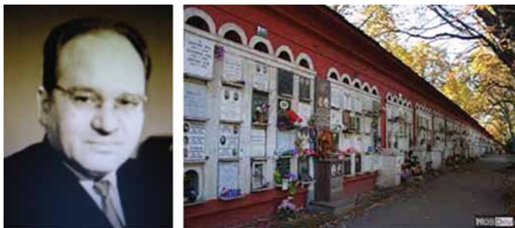
Колумбарий Новодевичьего кладбища