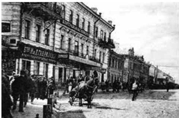
Город Рязань в начале XX века.

С 1925 по 1927 годы учился в школе II ступени и был кондуктором пассажирских поездов станции Рязань.