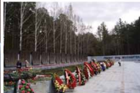
Прощание с В.Ф. Яковлевым 27 июля в Свердловском академическом театре драмы в Екатеринбурге. Мемориальный комплекс на Широкореченском мемориальном кладбище Екатеринбурга.