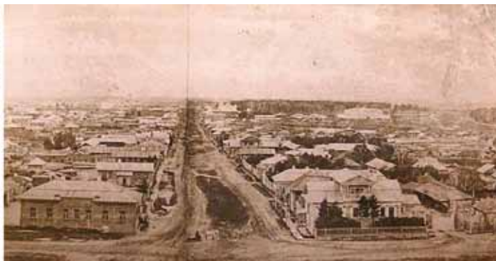
Село Юдино Петуховского района Уральской области. Город Ишим Тюменской области.