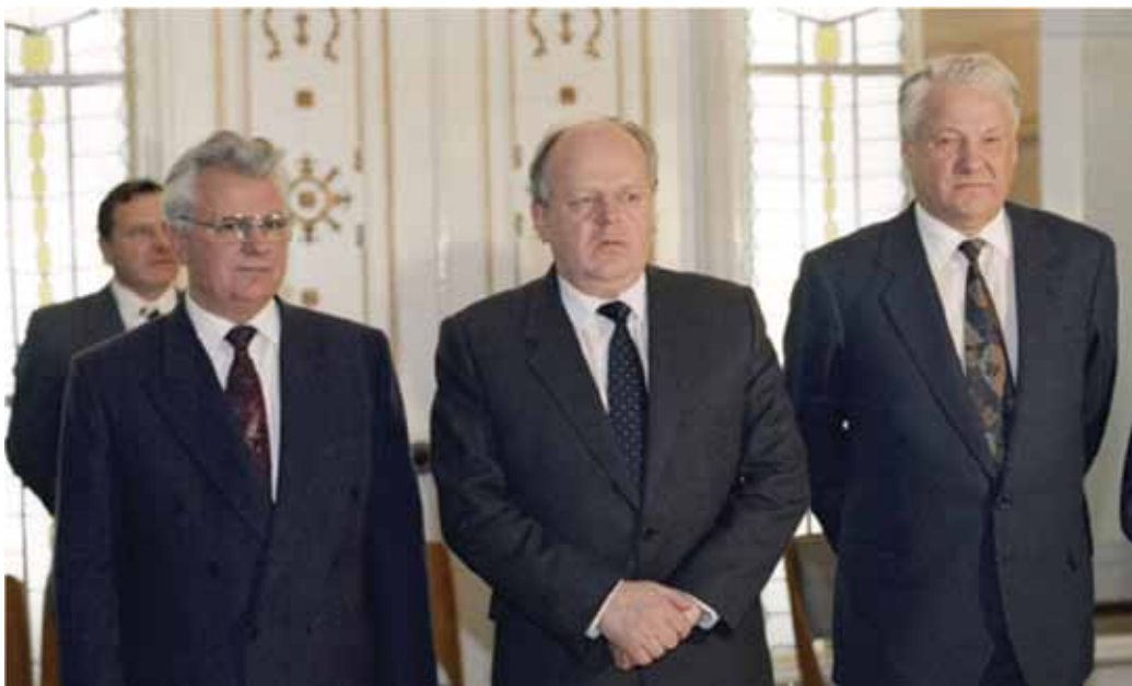
Подписавшие Беловежские соглашения Леонид Кравчук, Станислав Шушкевич и Борис Ельцин.