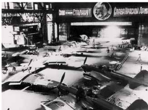
Село Малая Трещевка Воронежской области. Воронежский авиационный завод № 18.