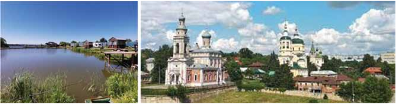
Деревня Семкино Высокиничской волости Тарусского уезда Калужской губернии (ныне – деревня Семкино Вышневолоцкого района Терской области). Город Серпухово.