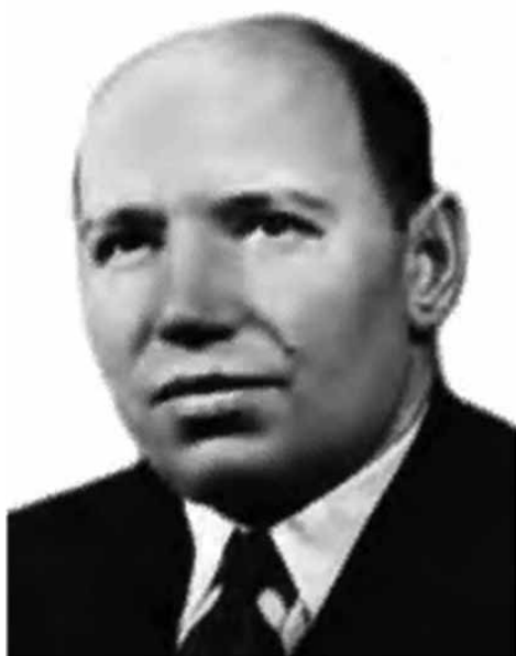
ДЕНИСОВ Андрей Иванович (1906–1984)

Председатель Юридической комиссии при Совете министров СССР с 1 августа 1956 года до 24 июля 1962 года.