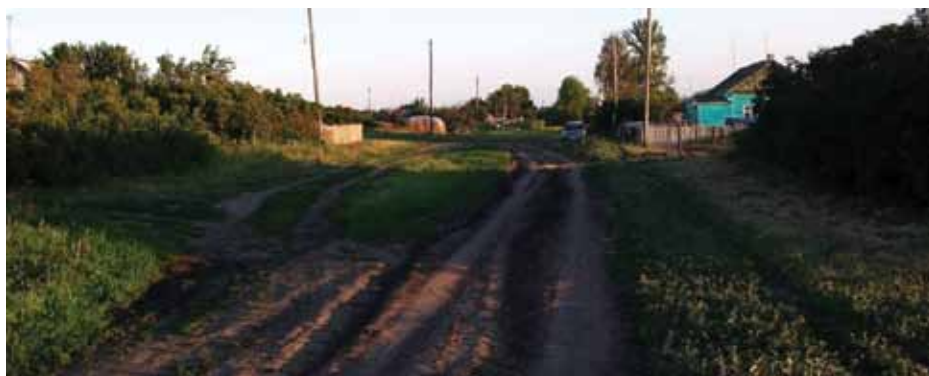
Местечко Озерки Тамбовской области.

В 1943 г. он защитил докторскую диссертацию на тему: «Государство и право: их взаимосвязь и