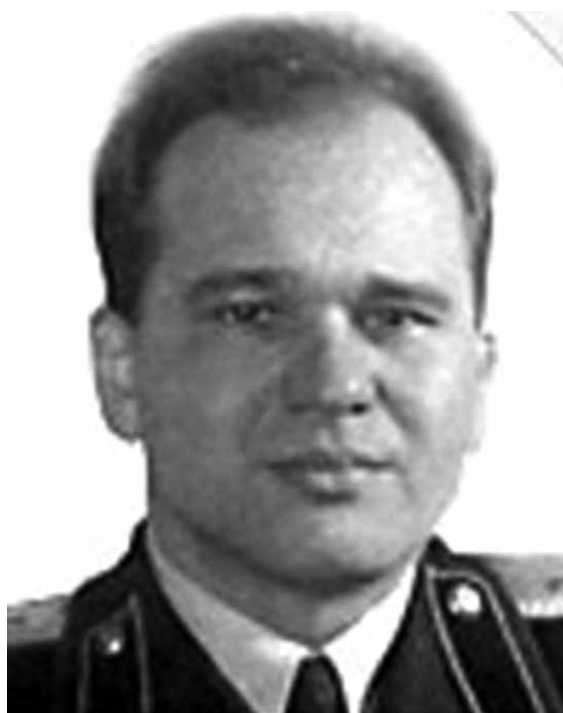
БОЛДЫРЕВ Владимир Афанасьевич (1900–1976)

Министр юстиции РСФСР с 11 мая 1957 года по 13 апреля 1963 года.