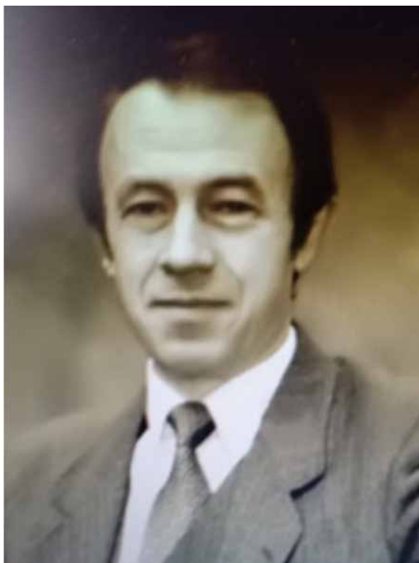
ЛУЩИКОВ Сергей Геннадьевич (р. 1951)

Министр юстиции СССР с 11 декабря 1990 года до 26 августа 1991 года, и.о. до 26 ноября 1991 года.