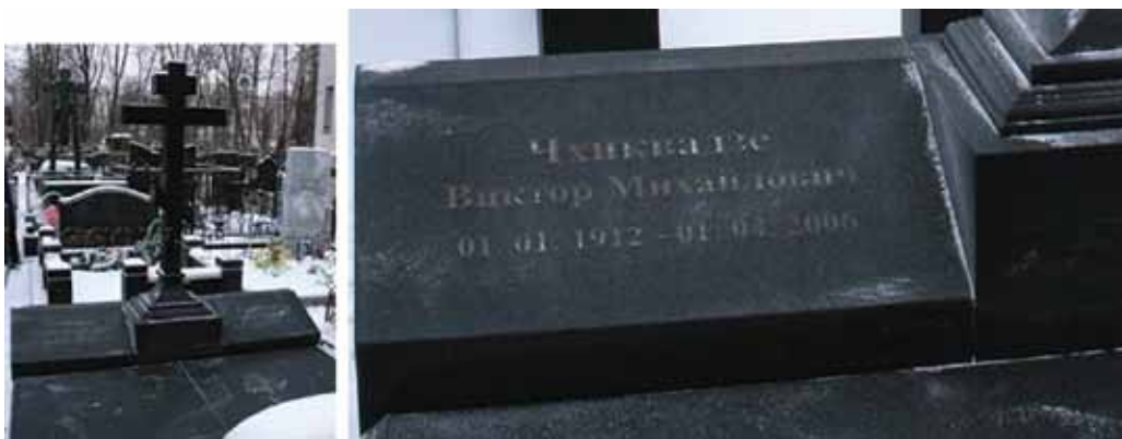
Могила В.М. Чиквадзе на Ваганьковском кладбище.