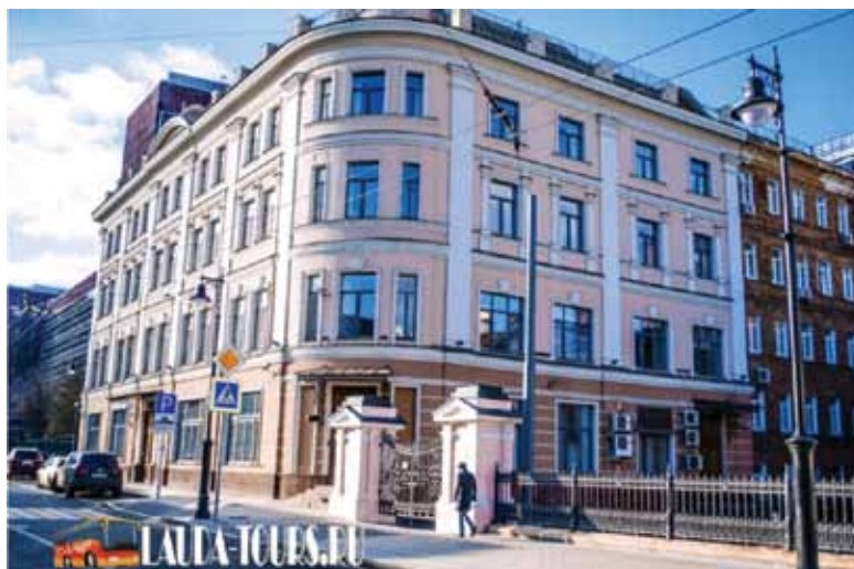
Здание бывшей Военно-юридической академии РККА. Москва, ул. Мясницкая, 41.

24 июля 1962 года В.М. Чхиквадзе возглавил Юридическую комиссию при Совете министров СССР и руководил ею до 26 марта 1964 года.