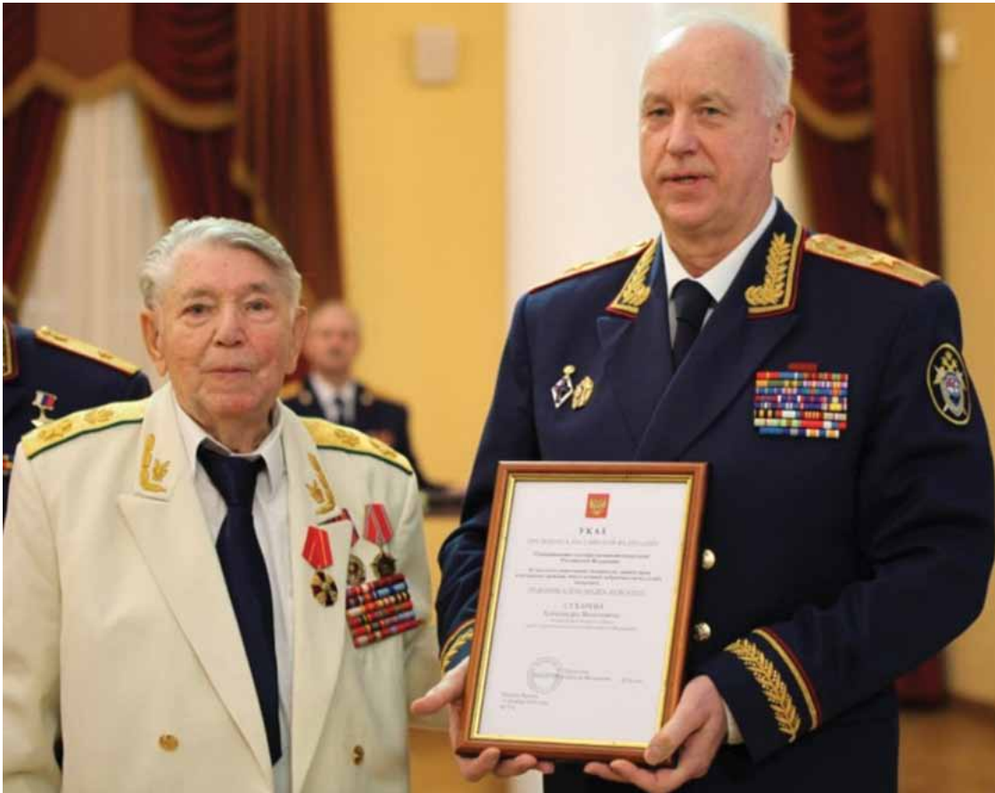
В день 95-летия Александру Сухареву Председатель Следственного комитета РФ Александр Бастрыкин вручил орден Александра Невского.

Литература об А.Я. Сухареве: [39; 50; 52; 64; 69].