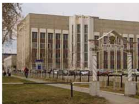
Село Буйск Сумского района Кировской области. Свердловский юридический институт.