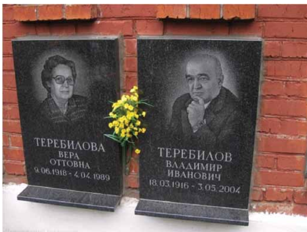
Надгробье четы Тербиловых на Новодевичьем кладбище в Москве.