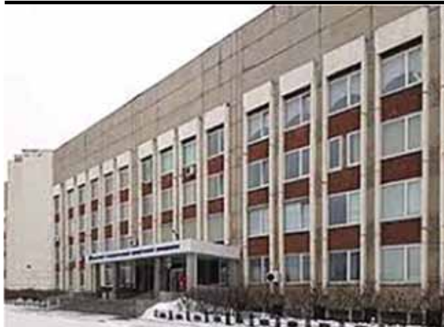
Свердловский юридический институт (ныне – Уральский Государственный юридический университет имени В.Ф. Яковлева.)

задействован в разработке законопроектов нового типа и именно им в сотрудничестве с Комитетом по законодательству при Верховном Совете РСФСР разрабатывались основы гражданского законодательства СССР, ставшие основой для будущего Гражданского Кодекса РФ. В немалой степени они стали нормативной базой для провозглашения и становления правового государства, идея которого впервые прозвучала на XIX партийной конференции.