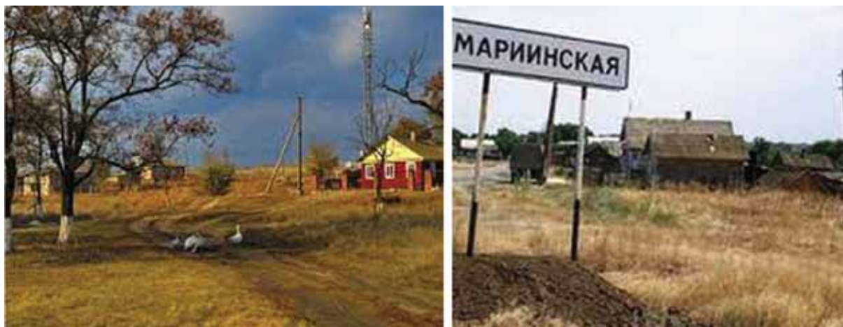
Станица Мариинская Первого Донского округа, Войска Донского.

должность прокурора Коммунистического района Московской области. С 1936 года по 1938 год работал прокурором Щелковского, Подольского районов.