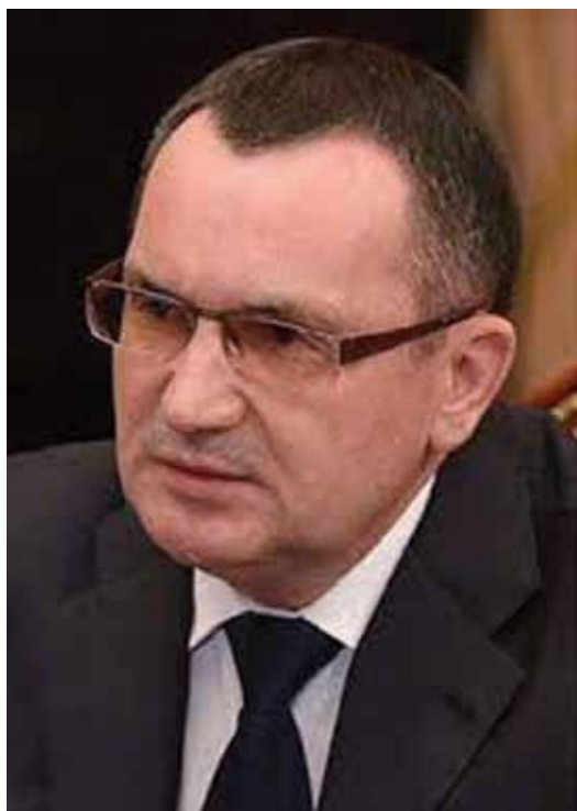
ФЕДОРОВ Николай Васильевич (р. 1958)

Министром юстиции РСФСР в этот период был Федоров Николай Васильевич, назначенный на этот пост еще 14 июля 1990 года.