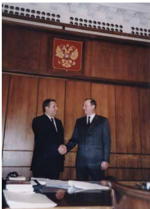
ФСБ России. А.И. Александров, Н.П. Патрушев