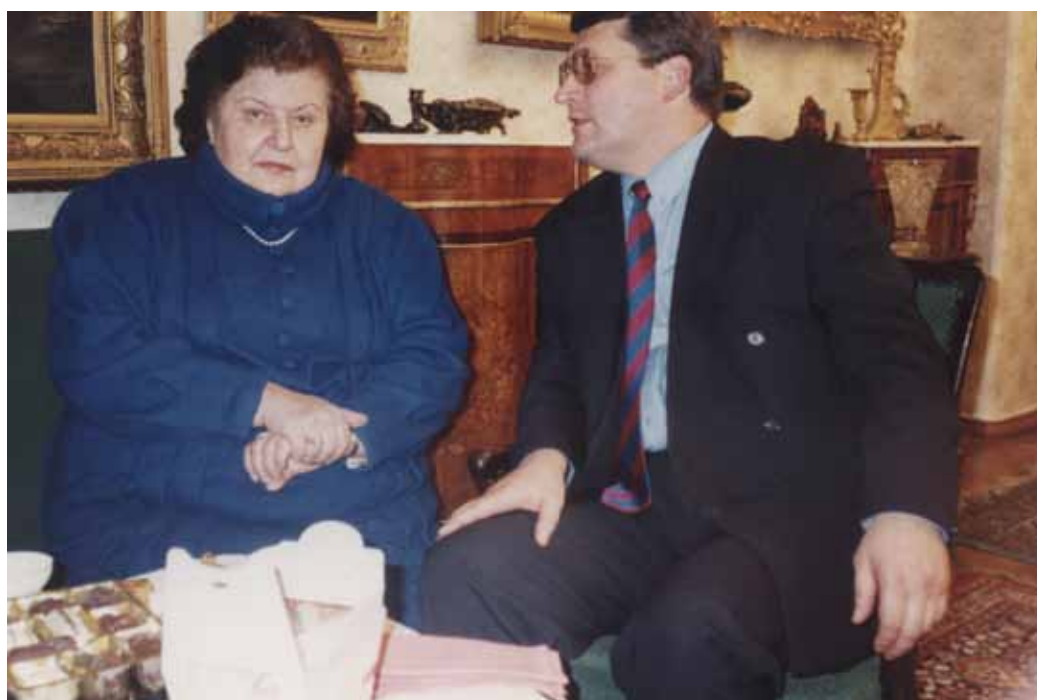
Встреча с академиком Н.П. Бехтеревой