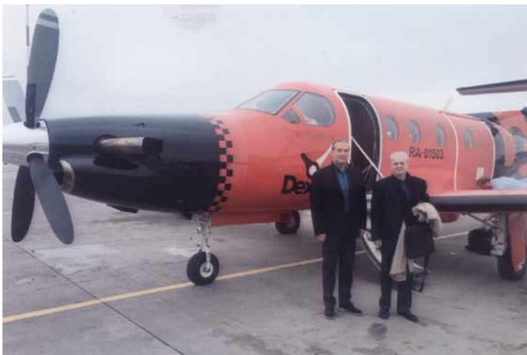
С М.Б. Пиотровским в Калуге