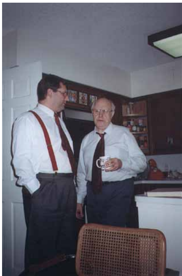
В гостях у М.Л. Растроповича